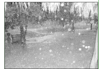
Unvorstellbare große Wassermengen fallen bei einem brasilianischen Gewitter vom Himmel.

können. Ich erinnere mich nur zu gut an 1998, als Brasilien im Endspiel gegen Frankreich gewann! Das Land bebte vor Lebensfreude und Begeisterung. Wie heißt es doch so schön: In der Welt zu Gast bei Freunden! In diesem Sinne wünsche auch ich Ihnen von Herzen besinnliche Weihnachten 2009