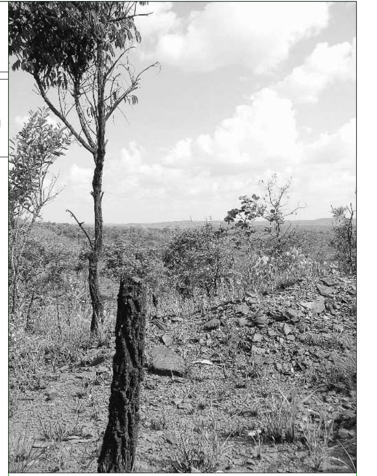
Der rote Sandweg trennt das Tal des Rio Sono vom Flussbett des Rio Tocantins.