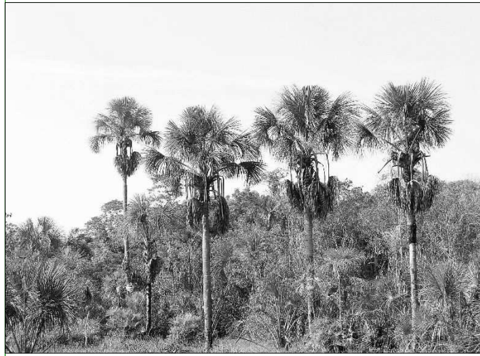
Aus Buriti-Palmen gewinnen die Xerente-Indianer Fasern, um Körbe und Matten zu flechten.